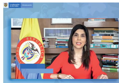
María Victoria Angulo Ministra de Educación Nacional

La primera sesión se trató sobre los retos del aseguramiento de la calidad de la educación superior en medio de esta crisis global que tiene implicaciones en la salud y consecuencias sociales, económicas y ambientales. La gran conclusión de este encuentro es que el trabajo colaborativo, la innovación y el rigor, nos permitirán dar un paso adelante, como lo señaló la Ministra de Educación Nacional, María Victoria Angulo.