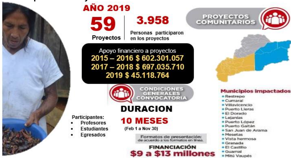
Ilustración 2. Impacto de Proyectos comunitarios 2017 – IPA 2019